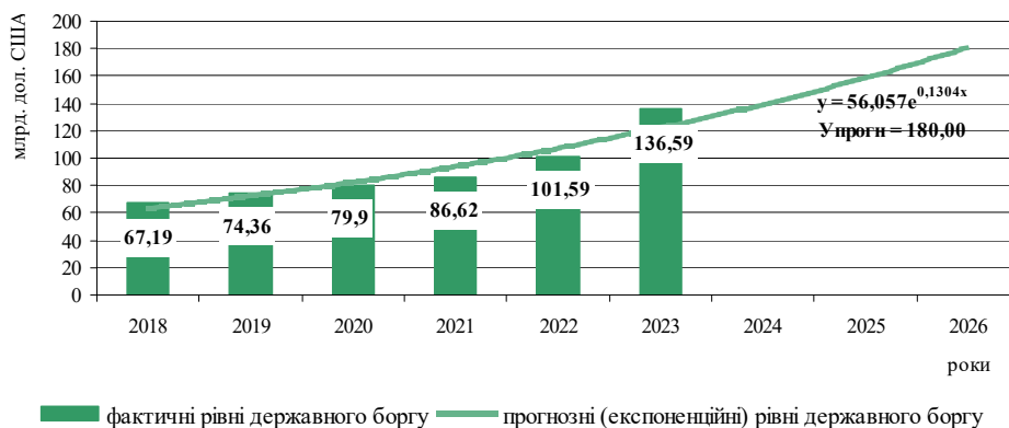
Рис. 3. Фактичні і прогнозні рівні державного боргу