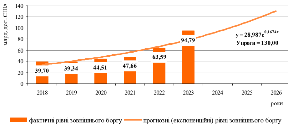
Рис. 2. Фактичні і прогнозні рівні зовнішнього боргу