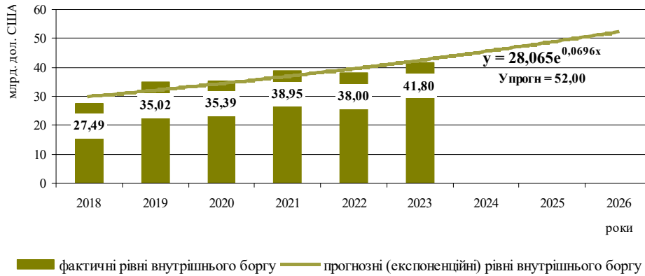
Рис. 1. Фактичні і прогнозні рівні внутрішнього боргу

Для прогнозування показників державного боргу використовуємо статистичний пакет аналізу даних в Excel. В якості аргументів статистичної функції РОСТ, яка обчислює експоненційну апроксиманту даних кривих, використано числові значення внутрішнього боргу, зовнішнього боргу, гарантованого боргу та державного боргу за 2018–2023 рр.