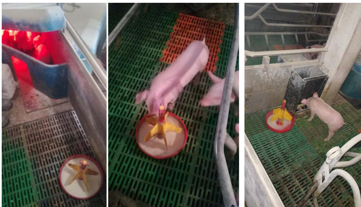
Рис. 1. Технологічні умови згодовування престаартеру та випоювання замітника молока

Протягом періоду досліджень проводилося спостереження за поведінкою поросят-сисунів зі встановленням часу, витраченого на відпочинок, рух, прийом корму та ін., за загальноприйнятими методиками у свинарстві [3; 7].