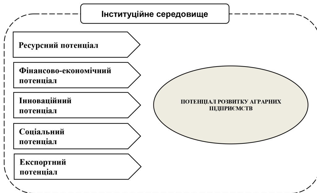
Рис. 3. Складові потенціалу розвитку аграрних підприємств

нерівномірним. Великі виробники активніше впроваджують сучасну техніку, цифрові платформи управління, елементи точного землеробства та автоматизації виробничих процесів. Для малих і середніх підприємств характерною є обмеженість інвестицій у технологічне оновлення, що знижує їхню продуктивність і конкурентоспроможність на внутрішньому та зовнішньому ринках.