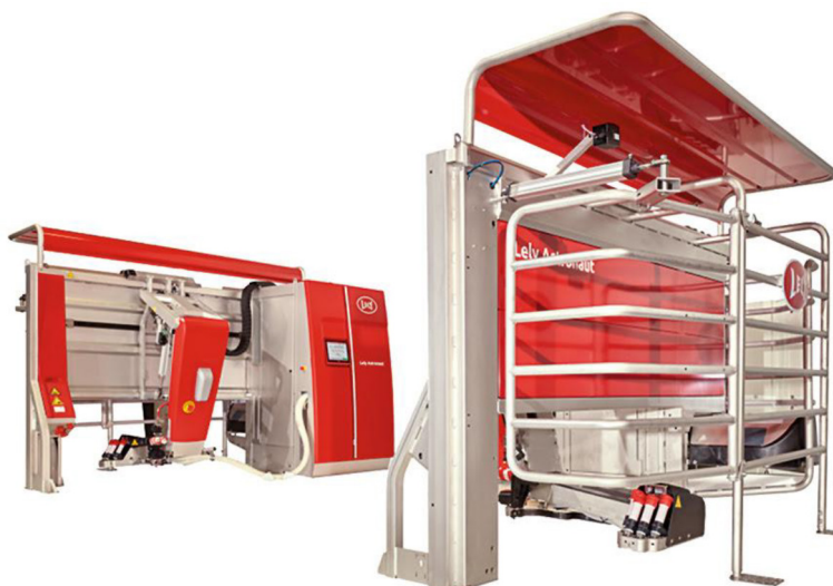
Рис. 2. Доїльний робот Lely Astronaut A5 (Нідерланди) [14]

Lely Astronaut A5 (Нідерланди) (рис. 2). Особливості – гібридний маніпулятор забезпечує надзвичайно тиху роботу. Система оснащена датчиками для аналізу кольору, електропровідності та температури молока з кожної чверті вимені окремо. Перевага – система «швидкого під'єднання» скорочує час перебування корови в боксі, збільшуючи пропускну здатність.