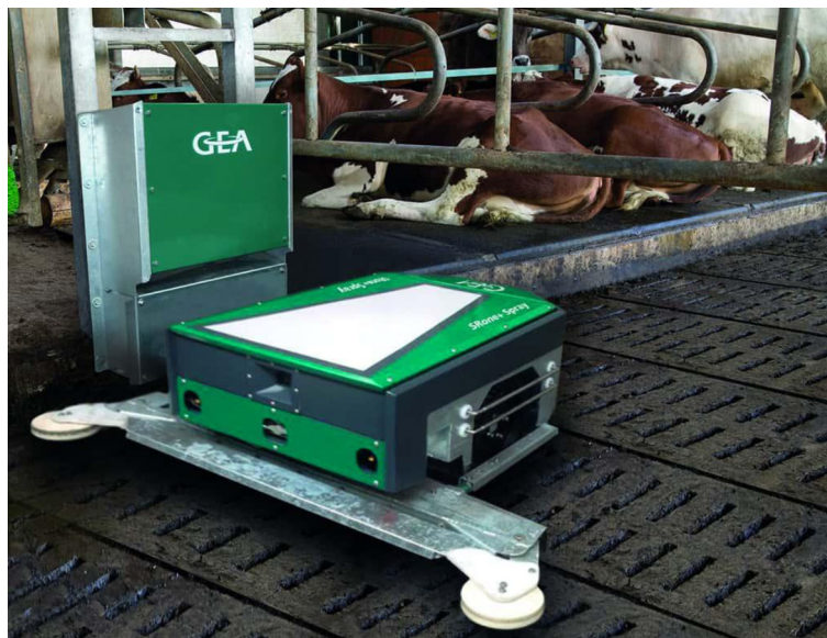
Рис. 8. GEA SRone / SRone+ (Робот-скрепер) [12]

Порівняння ключових моделей показано в табл. 1.