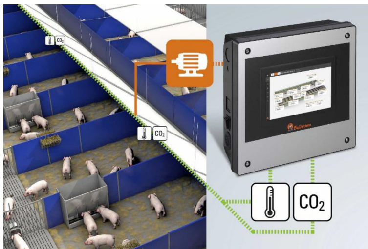
Рис. 7. Big Dutchman 310pro (Клімат-контроль) [4]

Big Dutchman 310pro – це високотехнологічний комп'ютер управління мікрокліматом, який забезпечує: автоматизацію вентиляції – регулювання припливних клапанів та витяжних вентиляторів на основі даних про температуру та вологість; контроль якості повітря – датчики \text{CO}_2 та \text{NH}_3 (аміаку) дозволяють системі підтримувати оптимальний склад повітря для здоров'я тварин; управління опаленням та охолодженням – інтеграція з калориферами та системами туманоутворення (CoolPad) для запобігання тепловому стресу; енергоефективність – адаптивні алгоритми знижують витрати електроенергії на 15–20 % порівняно з неавтоматизованими аналогами.