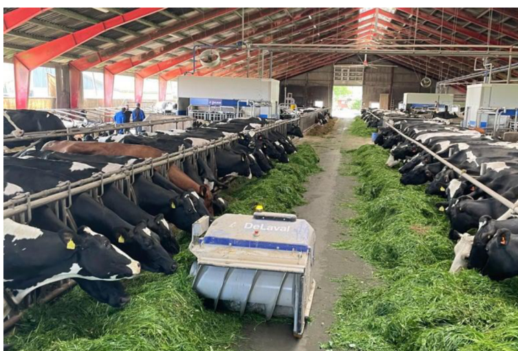
Рис. 4. DeLaval OptiDuo (Робот-підгогач) [5]