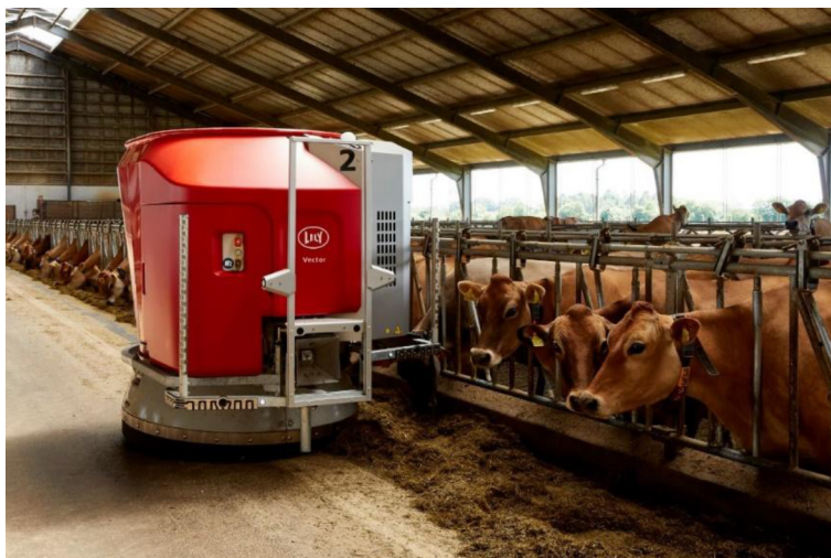
Рис. 3. Lely Vector (Автономний кормороздавач) [14]