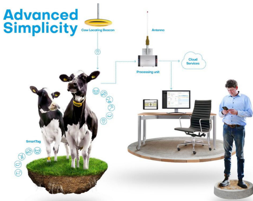
Рис. 6. Nedap CowControl [16]

Big Dutchman 310pro (Клімат-контроль) (рис. 7). Система керує витяжними вентиляторами, автоматичними шторами на вікнах та системою дрібнодисперсного розпилення води (туманоутворення). Датчики вимірюють рівень \text{NH}_3 (аміаку) та вологості, адаптуючи швидкість вентиляції.