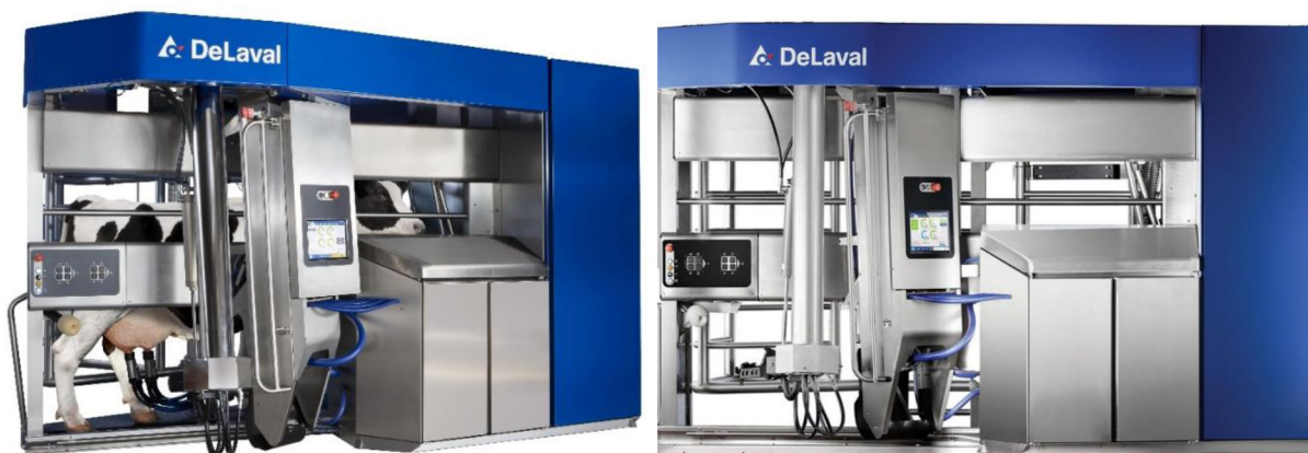
Рис. 1. Доїльний робот DeLaval VMS V300/310 (Швеція) [5]

Lely Astronaut A5 (Нідерланди) (рис. 2). Особливості – гібридний маніпулятор забезпечує надзвичайно тиху роботу. Система оснащена датчиками для аналізу кольору, електропровідності та температури молока з кожної чверті вимені окремо. Перевага – система «швидкого під'єднання» скорочує час перебування корови в боксі, збільшуючи пропускну здатність.