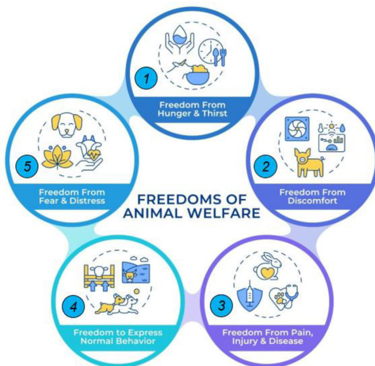
Рис. 9. Концепція добробуту тварин (Animal Welfare) [11]

У сучасному промисловому виробництві концепція добробуту тварин ( Animal Welfare ) трансформувалася із суто етичної категорії в науково обґрунтований складник технологічного процесу. Впровадження автоматизованих систем дозволяє реалізувати міжнародний стандарт «П'яти свобод», вперше сформульований Радою з добробуту сільськогосподарських тварин (FAWC) [11] (рис. 9):