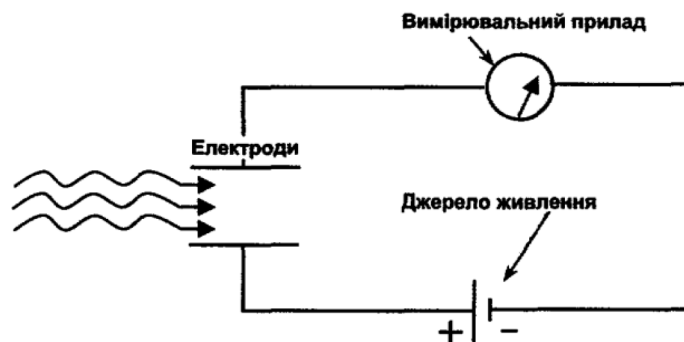
Рис. 1. Найпростіша схема іонізаційного детектора

За своєю конструктивною схемою іонізаційні детектори нагадують електричні конденсатори (рис. 1), де простір між електродами заповнений інертним газом або спеціальною газовою сумішшю [4, с. 91].