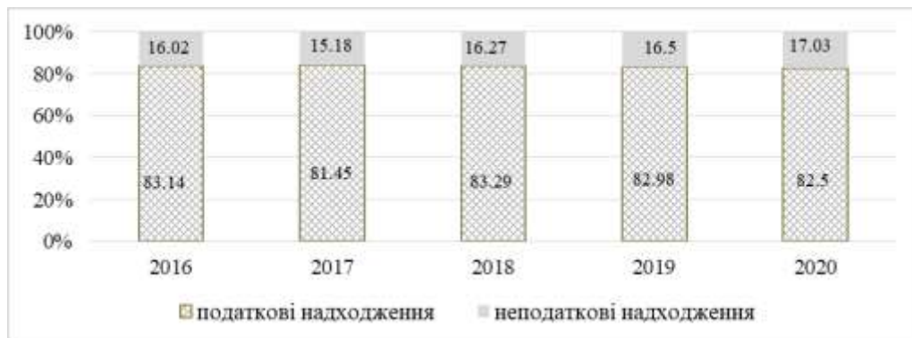
Рис. 3 Структура доходів зведеного бюджету України, %