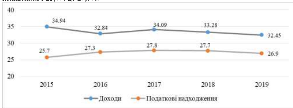
Рис. 1. Динаміка питомої ваги загальних доходів та податкових надходжень зведеного бюджету України до ВВП, % (2015-2019 рр.)

Результати дослідження. Частка доходів зведеного бюджету у ВВП протягом 2015-2019 рр. коливається з 34,94 % у 2015 р. до 32,45% 2019 рр., (рис.1) що було спричинено економічними трансформаціями та перехідним етапом в розвитку економіки України. Частка податкових надходжень у ВВП аналогічно протягом 2015–2019 рр. коливалася з 25,7% до 27,7%.